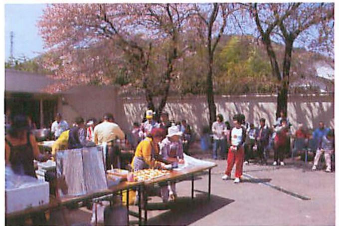
みやま園へ訪問して、昼食サービス（カレー・ラーメン・焼きまんじゅう）をするボランティア。