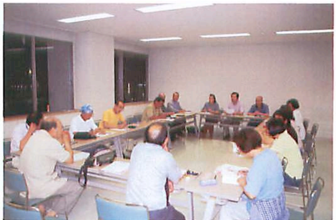
定例役員委員会は毎月第2火曜日に開催。