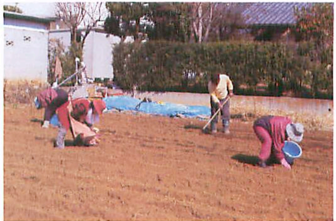
作業から収穫を喜び分かち合う共生社会のボラ協農園