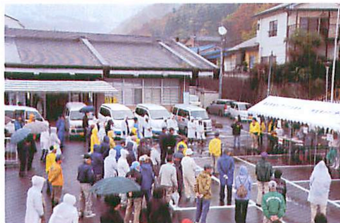
08.11.16 雨天の中 16 区自主防災会の協力による訓練（開会の様子）

V協ハイキング、災害ボラ派遣・支援、依頼ボランティア派遣等の活動資金づくりのために、うまいもの市を実施しています。