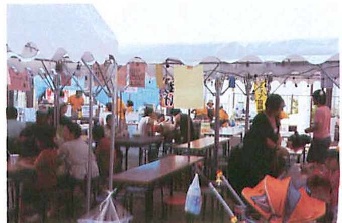
本町4丁目ジョイタウン広場のうまいもの市