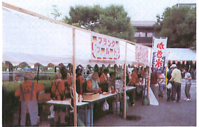
桐花園納涼祭で模擬店を実施するボランティア