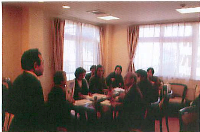
2007年 船橋イリーゼ シルバーリビングで説明を受ける参加者