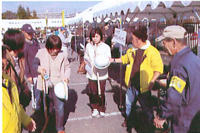
07.11.18 広沢町間の島第1町会自主防災会の協力による訓練

神戸・東灘区仮設住宅（阪神淡路大震災）への炊き出し支援が最初。以後、日本海重油流出事故、新潟県豪雨災害、中越・中越沖地震、能登半島地震への片付け・炊き出しボラ派遣や仮設住宅支援。災害時のボランティアセンターの立ち上げ訓練や防災の勉強会。