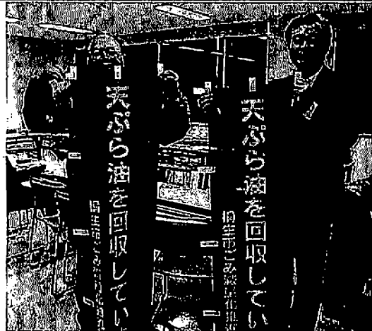
天ぷら油の回収を始める桐生市ボランティア協議会。市生活環境課でも新しいのぼりを貸し出し、活動をバックアップしている