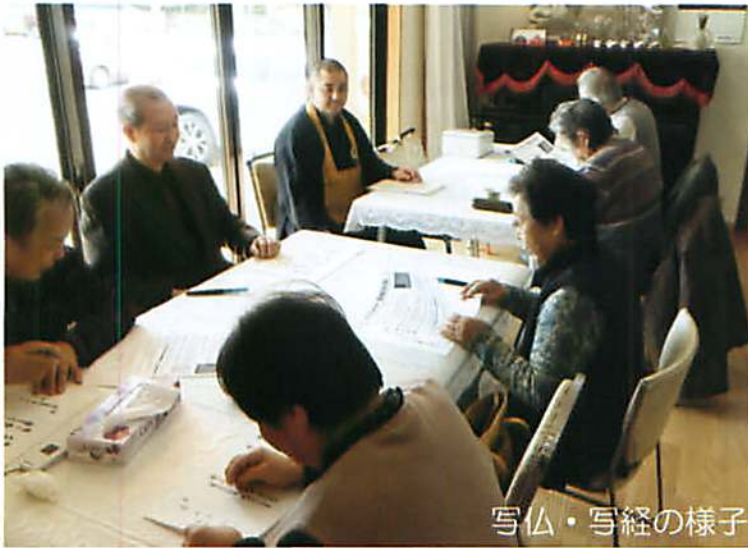
写仏・写経の様子