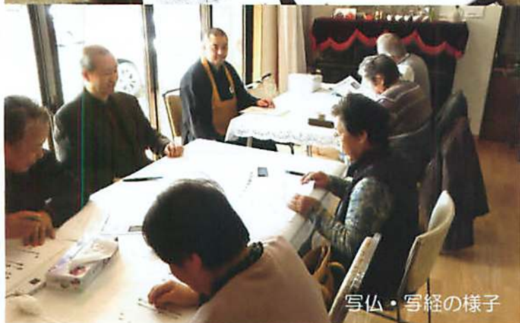
写仏・写経の様子